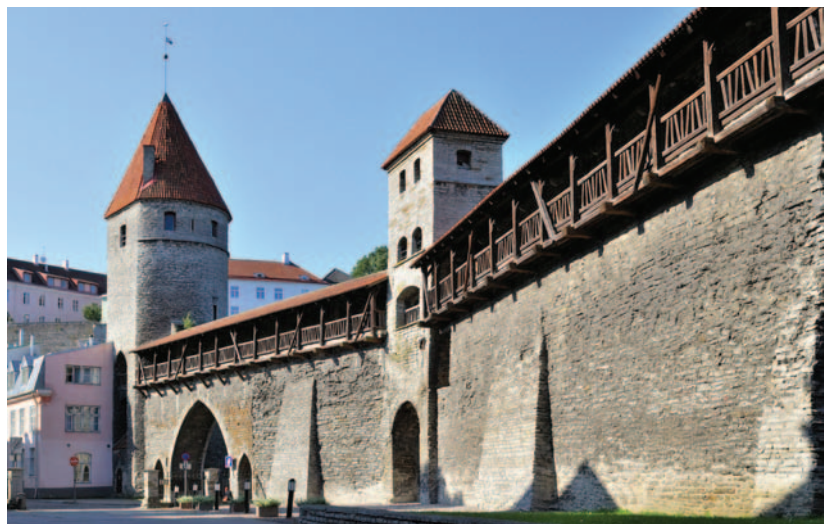
Muro de antigua fortaleza en Tallín.

Con un 75% de su comercio internacional destinado al mercado europeo, España no se encuentra entre los destinos exportadores. Estonia tampoco se encuentra entre los primeros puestos de nuestros mercados de exportación. Como ejemplo, señalar que el valor de las exportaciones en el último año (2009) se mantuvo en torno a los 70 millones de euros (con un saldo de la balanza comercial negativo de 4,5 millones de euros), lejos de la cifra récord registrada en 2006, año en el que las exportaciones españolas a aquel país superaron los 200 millones de euros (con un saldo también negativo de 7,5 millones). Los valores registrados en la primera mitad